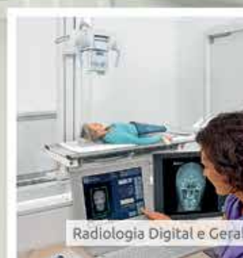
Radiologia Digital e Geral